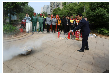
4月28日上午,溪西帝景小区联合悦兰社区开展消防实战演习。

通过此次演练,检验了应急救援预案的适用性和可操作性,提高了电梯公司与物业公司联合快速反应和协同处置能力,增强了业主们的安全乘梯知识和被困时如何应对的能力。(御江帝景 唐梅)