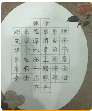
姓名:项楚诺 年龄:8岁 家长:金厦物业 曾灿灿