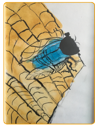
姓名:褚佳焯 年龄:5岁 家长:金厦商业 徐贞

我忽然觉得自己就是一朵野花,穿着火红的衣裳,站在阳光下。一阵微风拂来,我便开始跳舞,不光是我一朵,一地的野花都在舞蹈。风停了,我停止了舞蹈,过了好一会才回过神来,我才想起我不是那朵野花,我是在看这些野花而已!